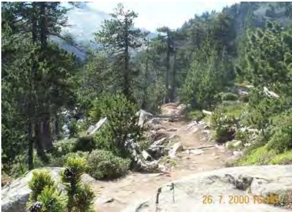
Exemple de réalisation de « soutènements »