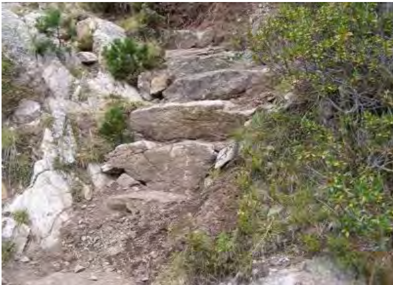
Exemples de réalisations de « blocages / emmarchements »