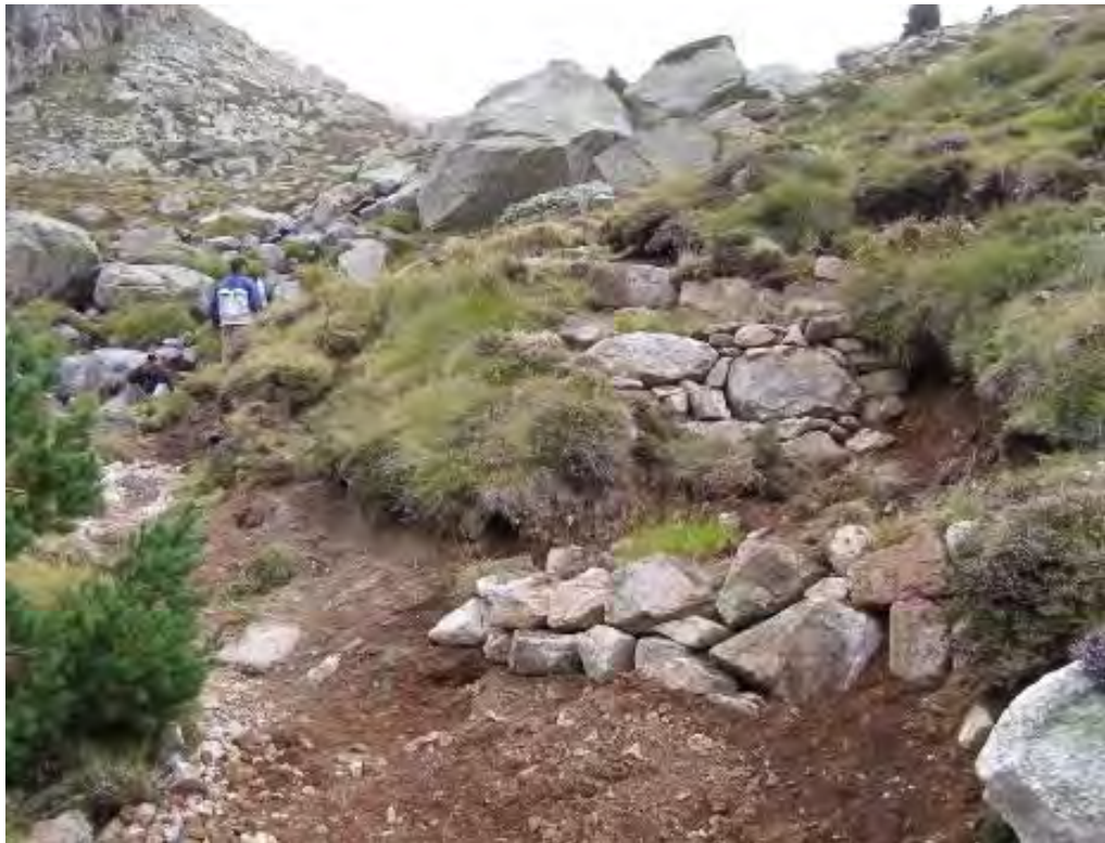
Exemples de « fermeture de faux-tracés »