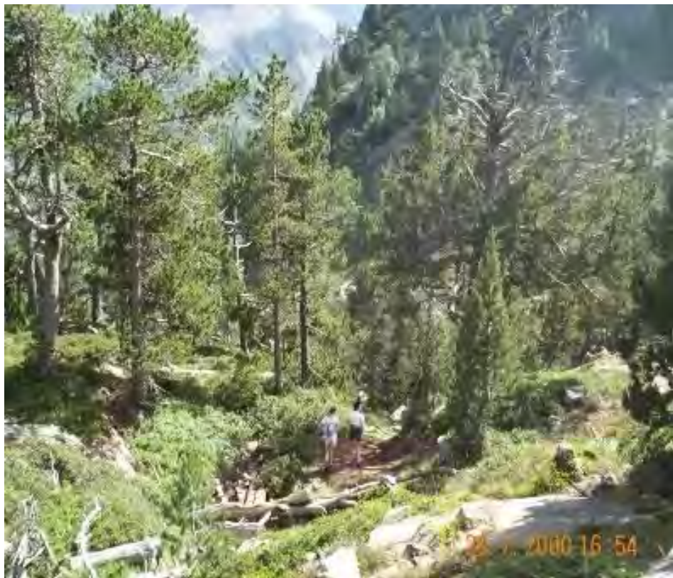
Exemples de traitements de « passage en éboulis »