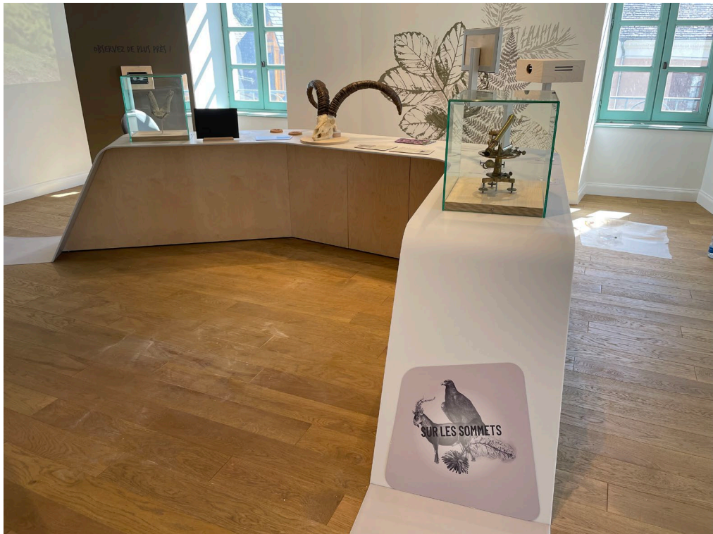
Un cheminement qui mène à sommet