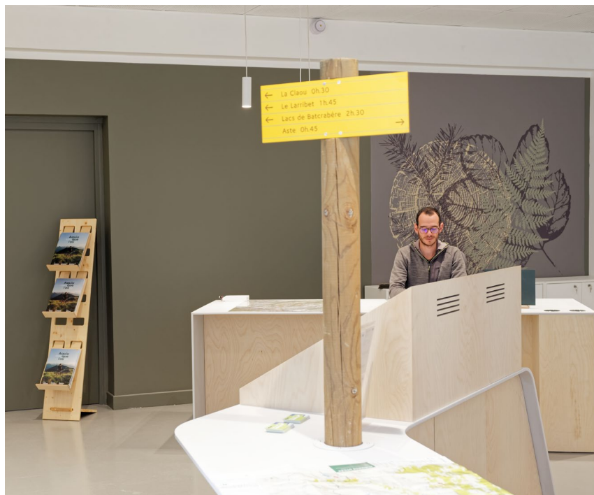
Un hôte d'accueil à la disposition des visiteurs