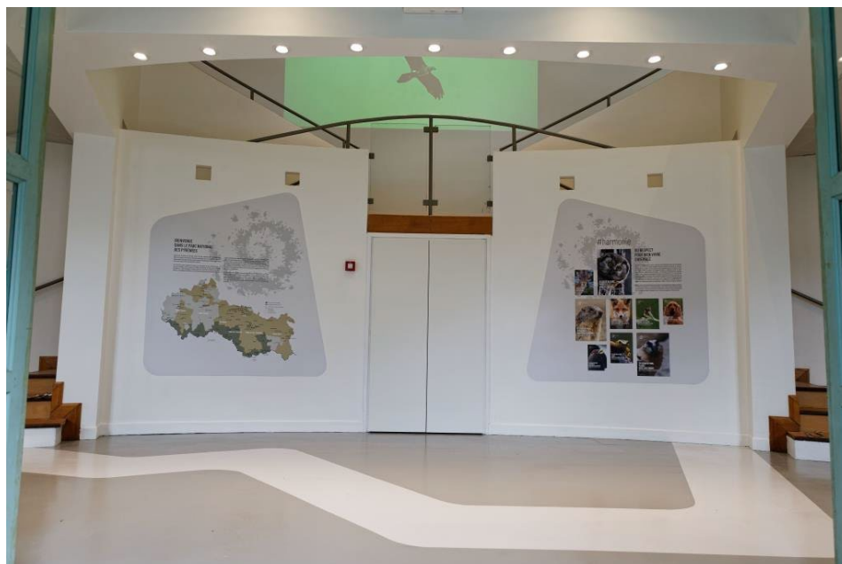
Un sentier matérialisé pour une découverte éveillée

Ces lieux labellisés « tourisme et handicap » pour les quatre handicaps, accueillent tous les publics. Cheminement et outils pédagogiques ont été pensés en ce sens.