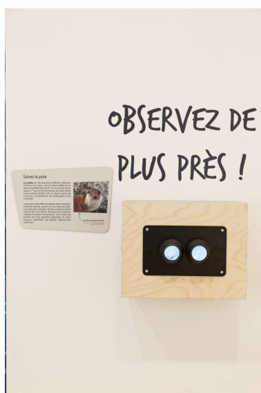
Des supports pluriels pour... observer de plus près

Pour chaque milieu, une réflexion sur le réchauffement climatique sur les milieux et les espèces est apportée à partir des données de l'Observatoire pyrénéen du réchauffement climatique.