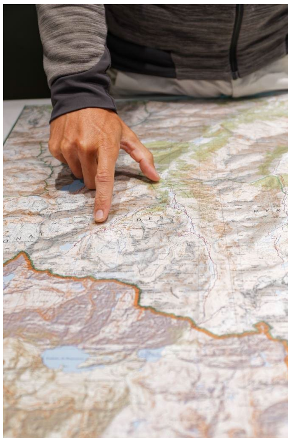
Préparer sa randonnée ou guidé par l'hôte d'accueil