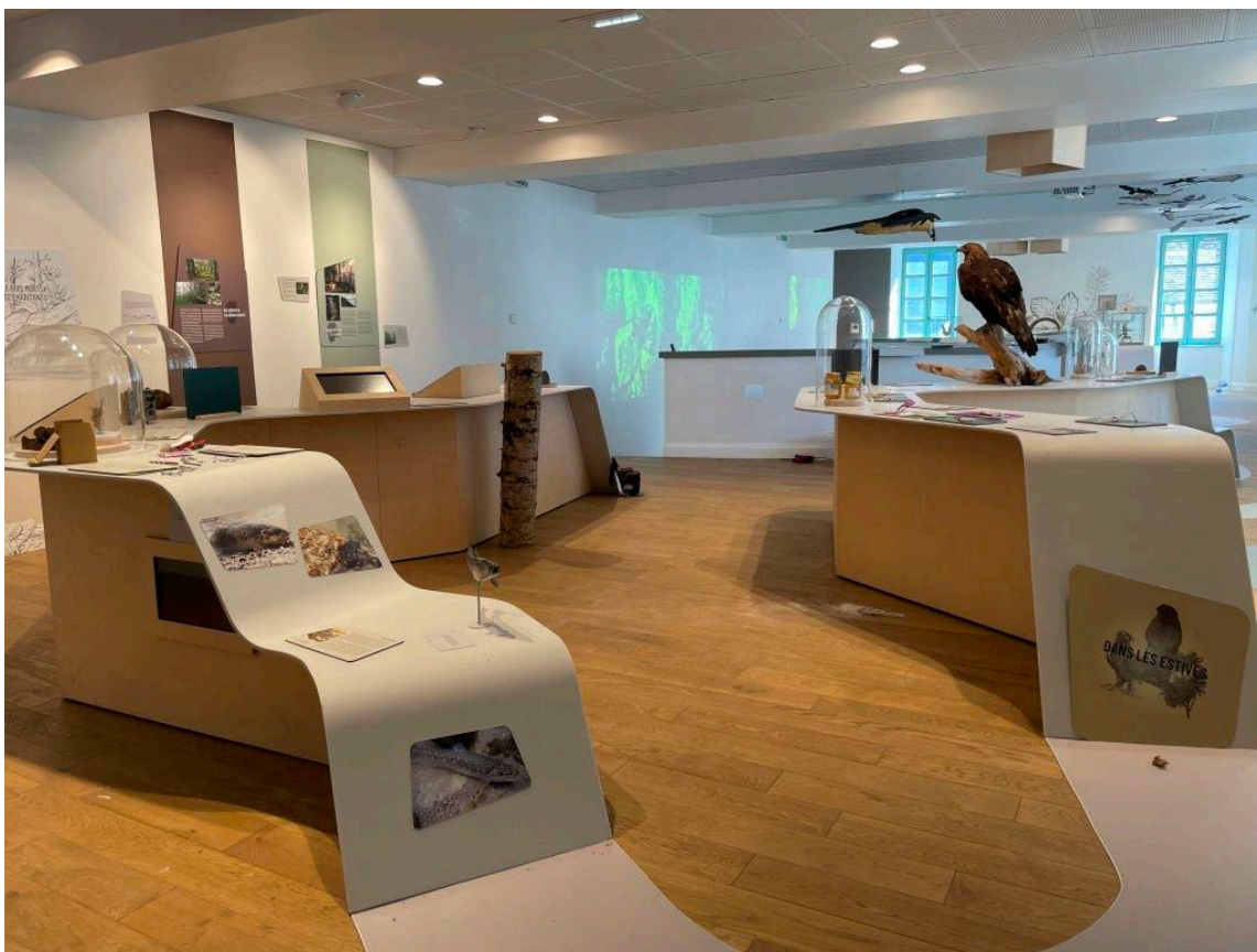
Par le sentier, de la vallée... jusqu'au sommet

Le premier étage de la Maison est consacré à la découverte de la biodiversité et de l'histoire au travers de trois milieux : les vieilles forêts, les estives et les sommets.