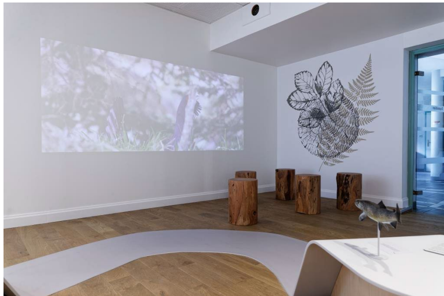
A la découverte du Grand tétras, en images