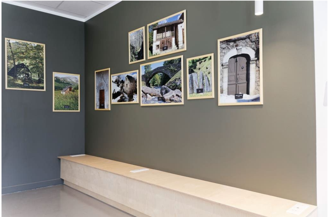
Se détendre ou recharger les batteries à l'espace cosy