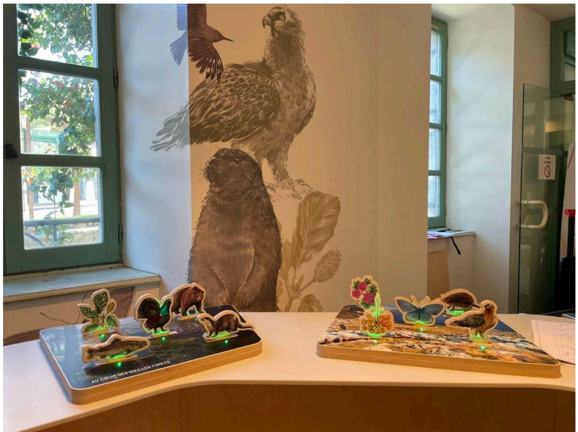
Ateliers pédagogiques pour les enfants... et pour els grands