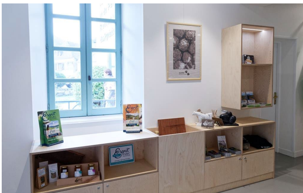
Découvrir les bénéficiaires de la marque Esprit parc national du val d'Azun