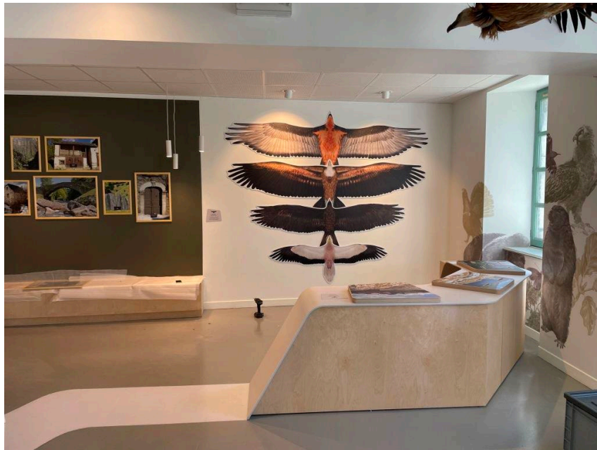
Des silhouettes à taille réelle des rapaces emblématiques observables en val d'Azun