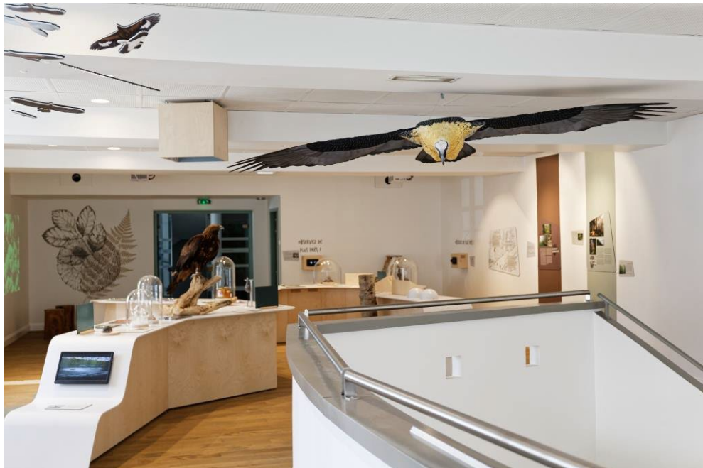
Sous la protection du Gypaète barbu, à taille réelle

Après avoir ainsi cheminé au sein de la Maison du Parc national des Pyrénées et du val d'Azun, le visiteur pourra profiter pleinement de sa randonnée, en pleine conscience de la nature.