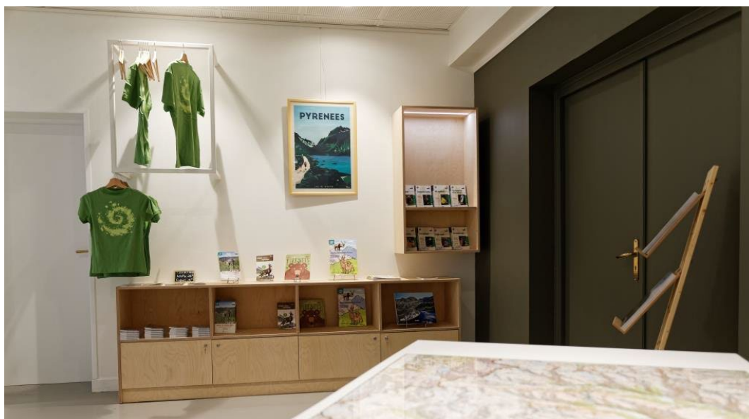
L'espace boutique © Christophe Cuenin – Parc national des Pyrénées