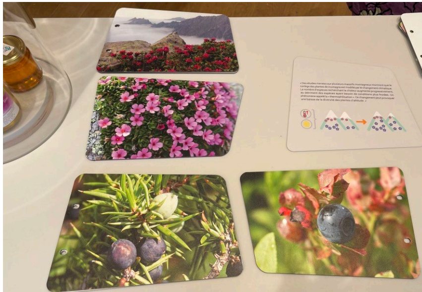
A la découverte des espèces en images ou en réel