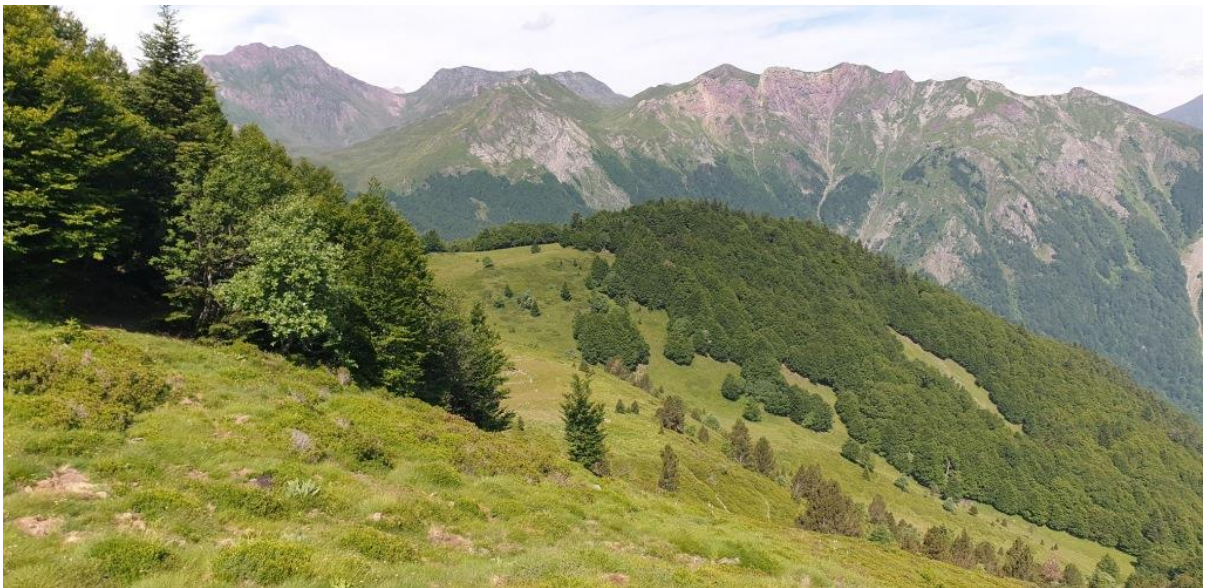
Lieu-dit Lazaque, un habitat caractéristique du grand tétras

Raréfaction de la ressource alimentaire, difficulté de mobilité, les forts enjeux patrimoniaux du site conduisent le Parc national et ses partenaires à se mobiliser dans le temps, pour la conservation du Grand Tétrás .