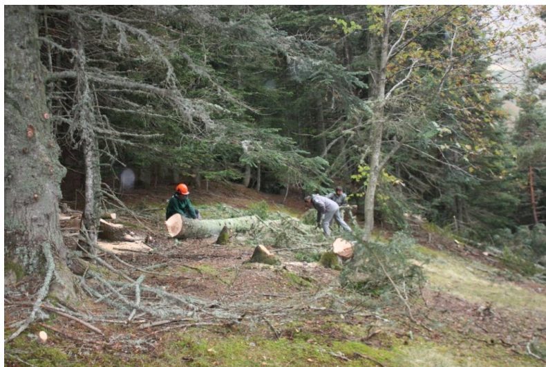
Bucheronnage au Lazaque

Avec la fermeture du milieu forestier, le Grand tétras souffre de la disparition des aiguilles de Pin, ressource alimentaire hivernale précieuse pour le galliforme. Dès 2016, le Parc national, en concertation avec la commune de Cette-Eygun et l'Office national des forêts, a procédé à la réouverture du milieu sur deux hectares.