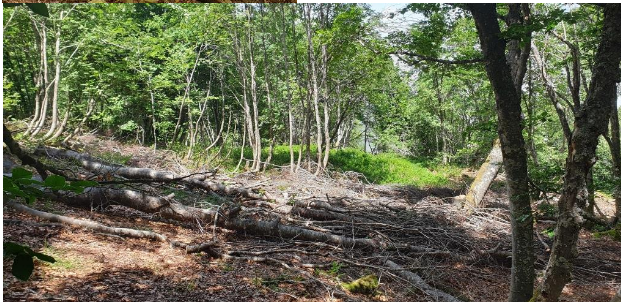
Réouverture de la hêtraie sapinière ©Franck Reisdorffer – Parc national des Pyrénées

©Franck Reisdorffer – Parc national des Pyrénées