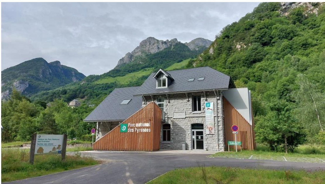
© R. Camviel – Parc national des Pyrénées

A l'entrée du village d'Etsaut, se dresse la Maison du Parc national des Pyrénées.