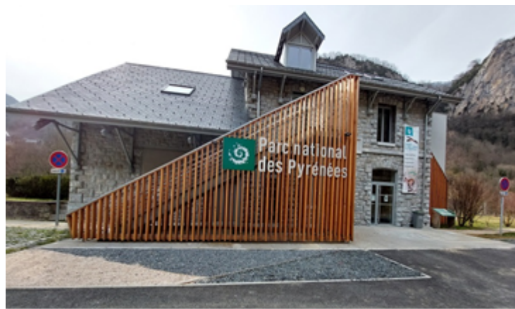
La Maison du Parc national des Pyrénées pendant les travaux