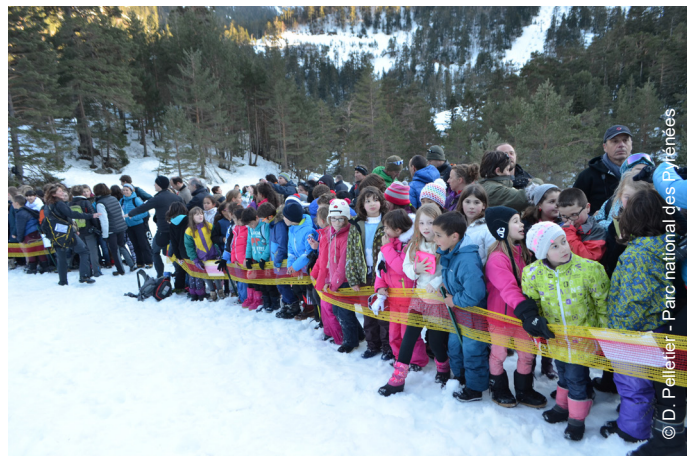
▲ Les élèves prêts à accueillir les bouquetins à Cauterets