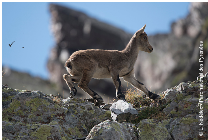
▲ Chiva, première cabri née sur le territoire du Parc national le 15 mai 2015