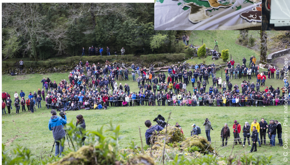
▲ Scolaires et grand publics réunis pour assister au 1er lâcher en vallée d'Aspe