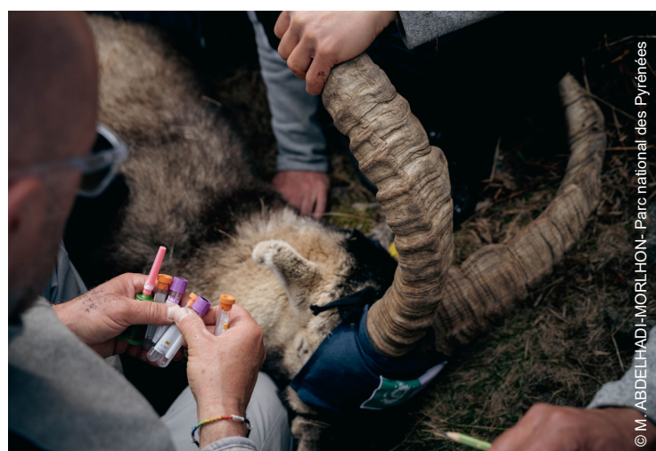
▲ Prélèvement sur un mâle en vue du suivi sanitaire

Le suivi des ongulés ainsi réalisé annuellement par le Parc national a permis de constater le très bon état sanitaire des animaux : les dix bouquetins capturés en 2023 étaient exempts de maladie.