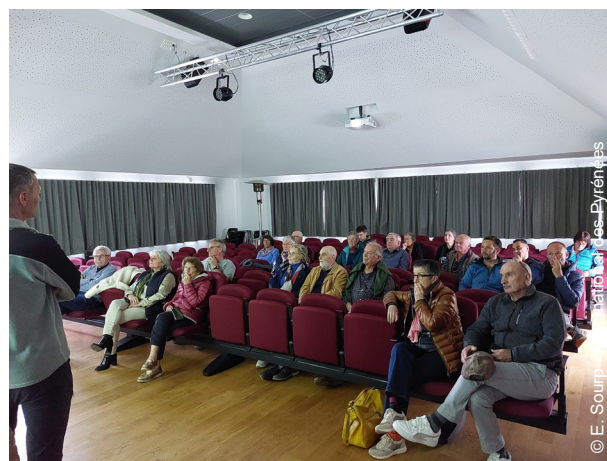
▲ Réunion d'information en vallée d'Aure

En vue d'une appropriation de la venue de cette nouvelle espèce par tous, des nombreuses réunions de concertation ont été menées à l'hiver 2023-2024, avec les élus et les représentants des agriculteurs et des chasseurs de la haute vallée d'Aure. S'en sont suivies des réunions publiques avec les habitants et le bouquetin est attendu avec impatience dans la vallée.