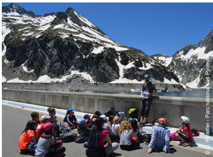
▲ Sensibilisation des élèves du collège d'Arreau - Cap de Long - 2018