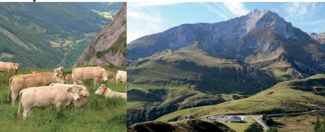
La pastoralisme est très présent sur les versants du Massif du Gabizos