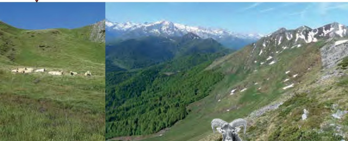
Le col d'Espadres