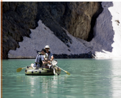
Suivis dans le lac du Pavé, avec l'AFB

Nous développerons une approche intégrée du territoire pour organiser les accès du public aux espaces naturels.