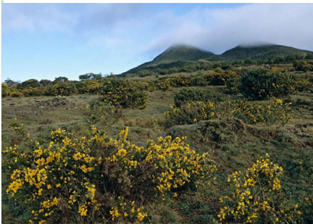
Progression de l'Ajonc d'Europe sur les versants de La Réunion. PNR

Nous piloterons à La Réunion l'élaboration et la mise en œuvre ( programme opérationnel ) d'une nouvelle stratégie régionale pour la lutte contre les espèces exotiques envahissantes et nous y expérimenterons un dispositif de caméras pièges pour le suivi de la dynamique des populations de Cerf de Java.