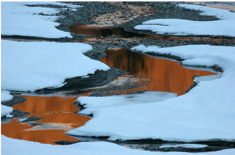
Gravière dans la neige.

Nous poursuivons et renforcerons la coordination des actions de contrôle sur les territoires de Parcs nationaux dans le cadre des liens mis en place localement avec les Parquets (exemple du Groupe opérationnel Calanques) afin d'optimiser l'efficacité des actions de police conduites.