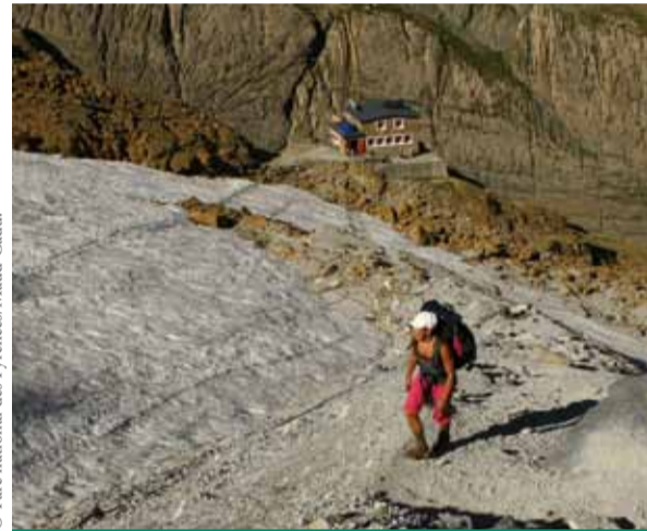
La charte fixe des objectifs de protection et de mise en valeur durable du cœur.

Les richesses naturelles du parc national en font une référence mondiale en matière de biodiversité. Il s'agit