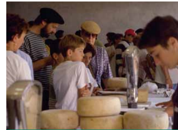
Les orientations définies dans la charte concourent à un développement équilibré des vallées.