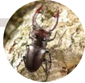
N. Goux / CEN Midi-Pyrénées

Ce coléoptère est l'un des plus grands des forêts pyrénéennes. Son nom vient de la ressemblance des mandibules du mâle avec les bois du cerf et du fait qu'il vole. Ces mandibules lui servent en cas d'affrontement avec ses congénères (elles peuvent aussi pincer très fort). Très commun dans les forêts de feuillus, ses larves vivent dans les souches en décomposition pendant 3 à 5 ans avant de se transformer en adulte.