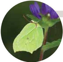
S. Déjean / CEN Midi-Pyrénées