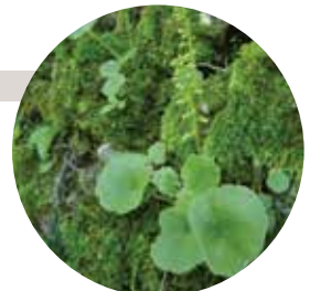
F. Laigneau / CBNPMP

Vivace, il se développe sur les vieux murs ombragés et peut mesurer jusqu'à 40 cm de haut. Du printemps à l'été, le randonneur pourra observer les délicates inflorescences portant de multiples fleurs blanches teintées de vert. Ses feuilles sont comestibles fraîches et auraient des propriétés cicatrisantes reconnues.