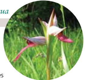
S. Déjean / CEN Midi-Pyrénées

Relativement fréquente à l'échelle du département, cette magnifique orchidée plutôt discrète traduit localement la présence d'un microclimat chaud et humide. À une échelle régionale voire au-delà, la raréfaction de l'habitat de cette espèce représente une menace pour sa conservation. Sur la commune, l'espèce n'est pas menacée et les pratiques en cours sont favorables à son maintien.