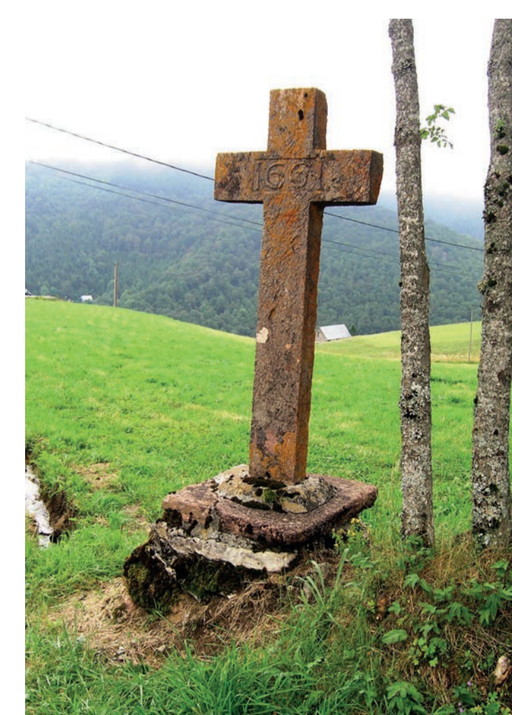
Vallée de Campan (65)