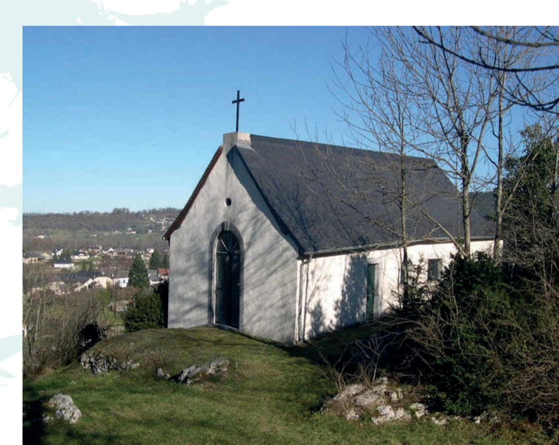
Arudy (64) - chapelle