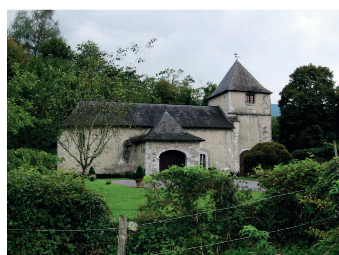
Seignac-Meyrac (64) - chapelle Saint-Saturnin à Meyrac