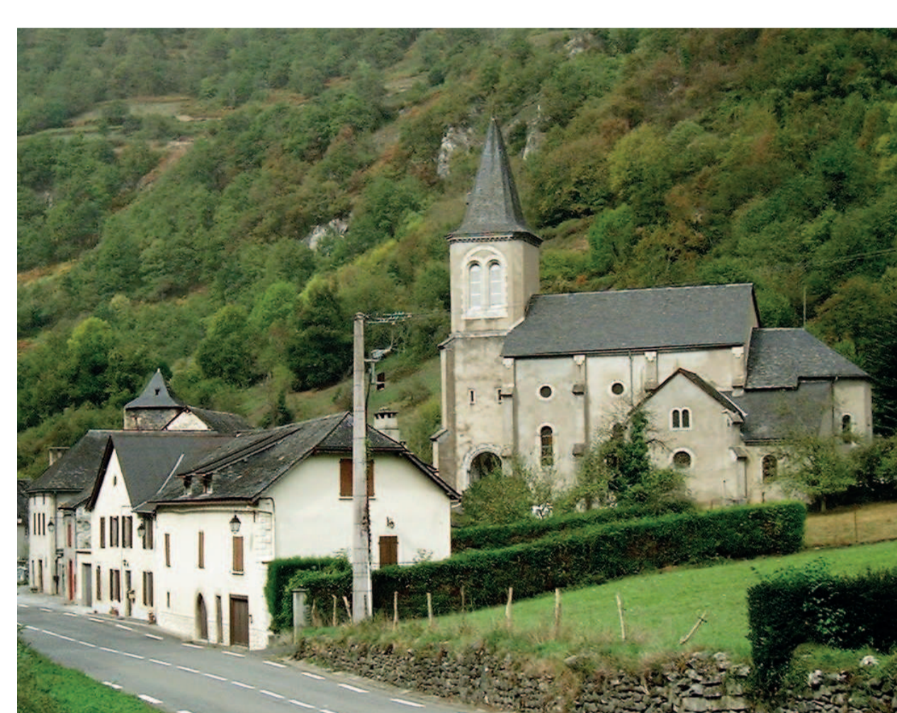
Cette-Eygun (64) - église d'Eygun