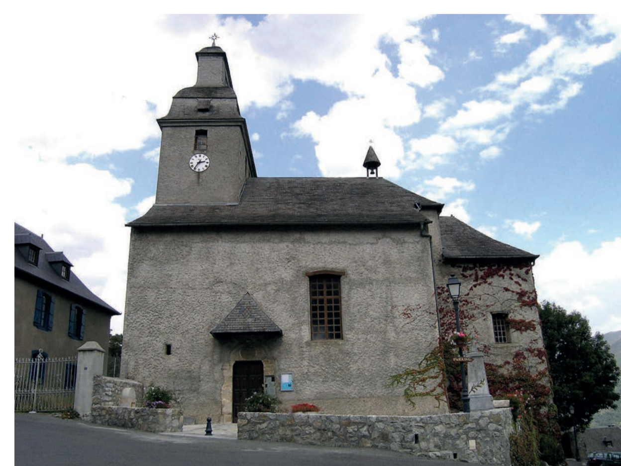
Arcizans-Avant (65) - église inscrite aux MH en 1979