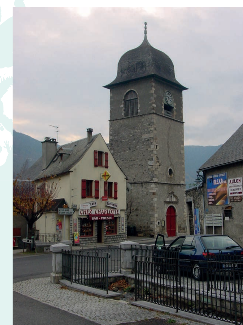
Guchen (65) - église inscrite aux MH en 1989