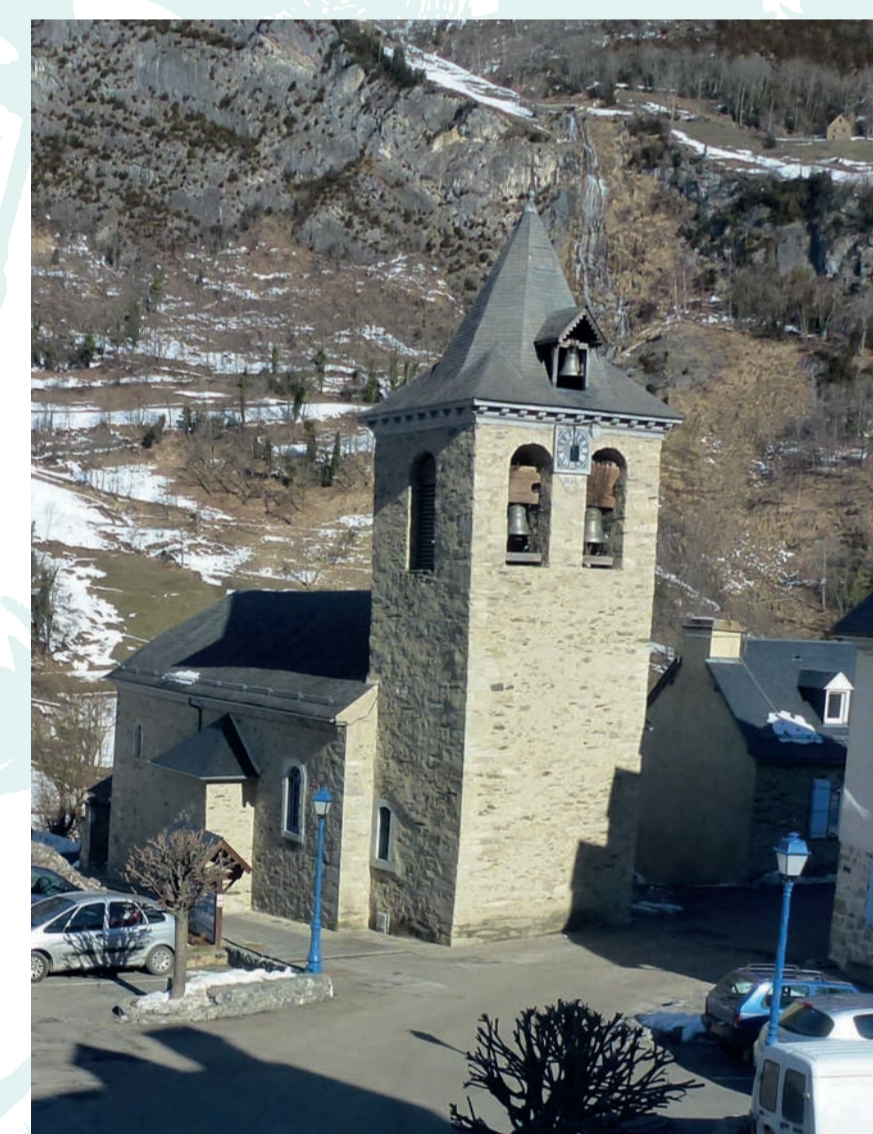
Viella (65) - église inscrite aux MH en 1990