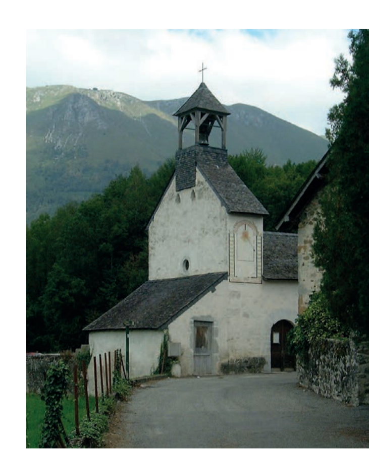
Accous (64) - chapelle de Jouers inscrite aux MH en 1986