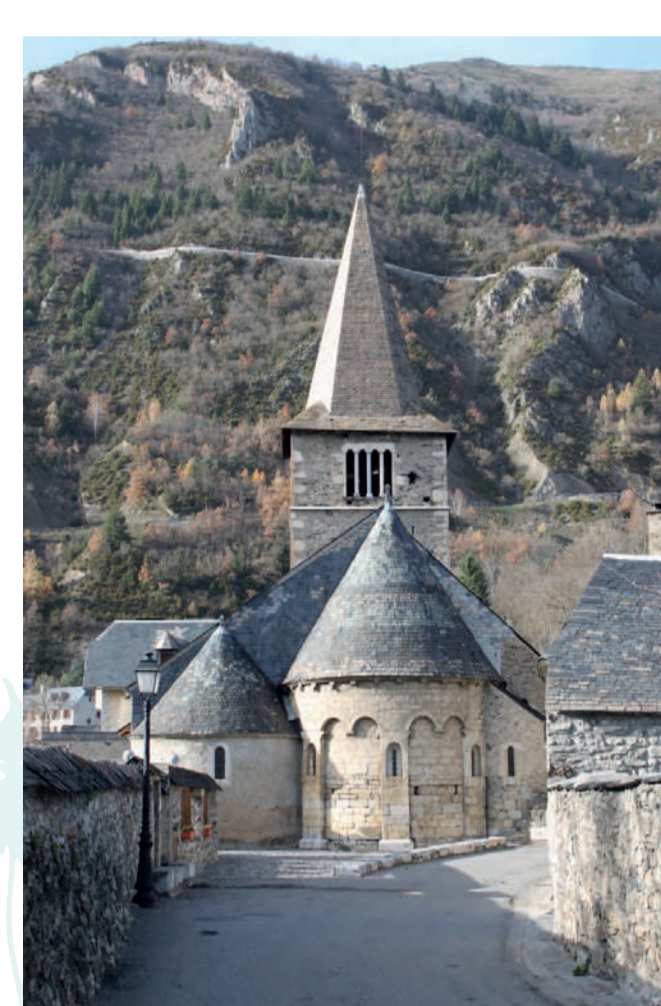
Vielle-Aure (65) - église classée aux MH en 1840