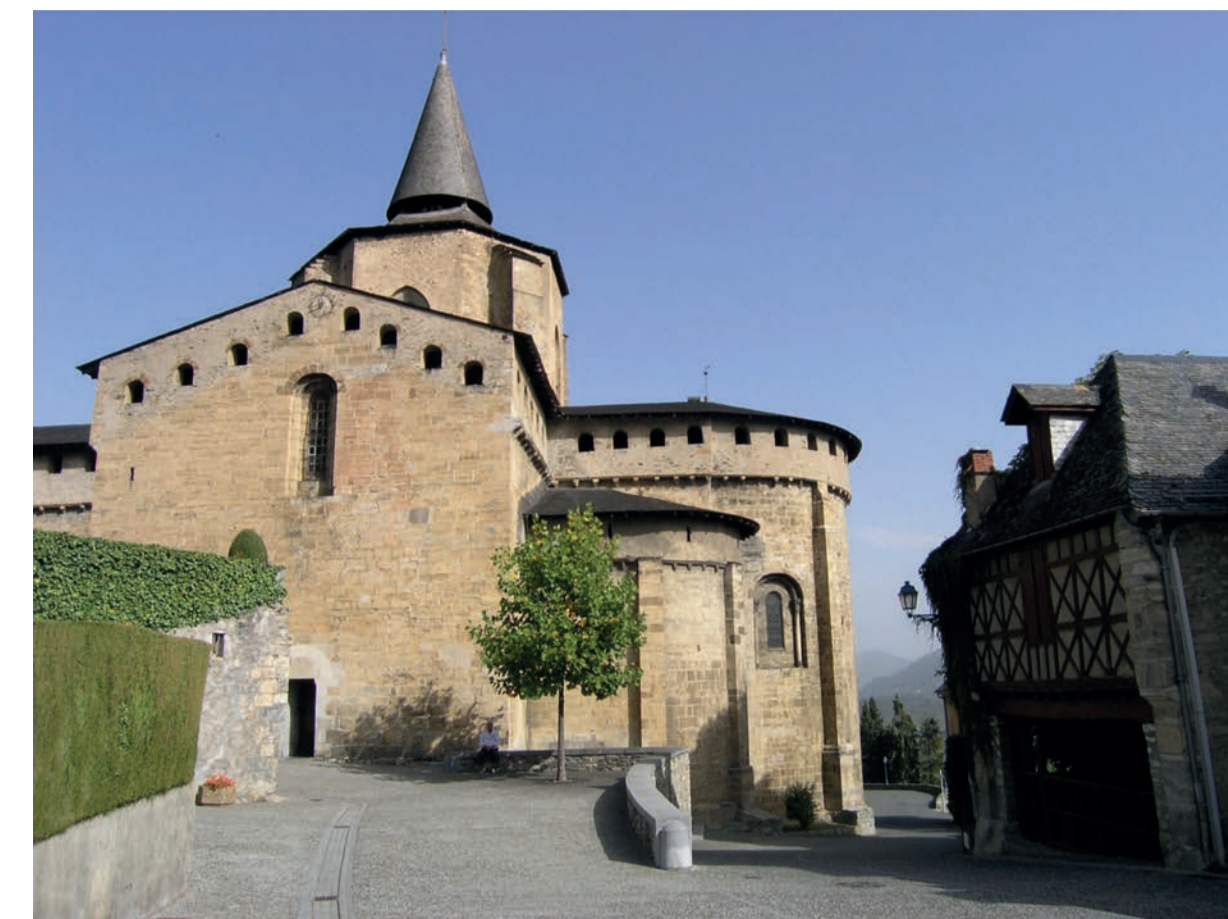
Saint-Savin (65) - abbatale classée aux MH en 1840