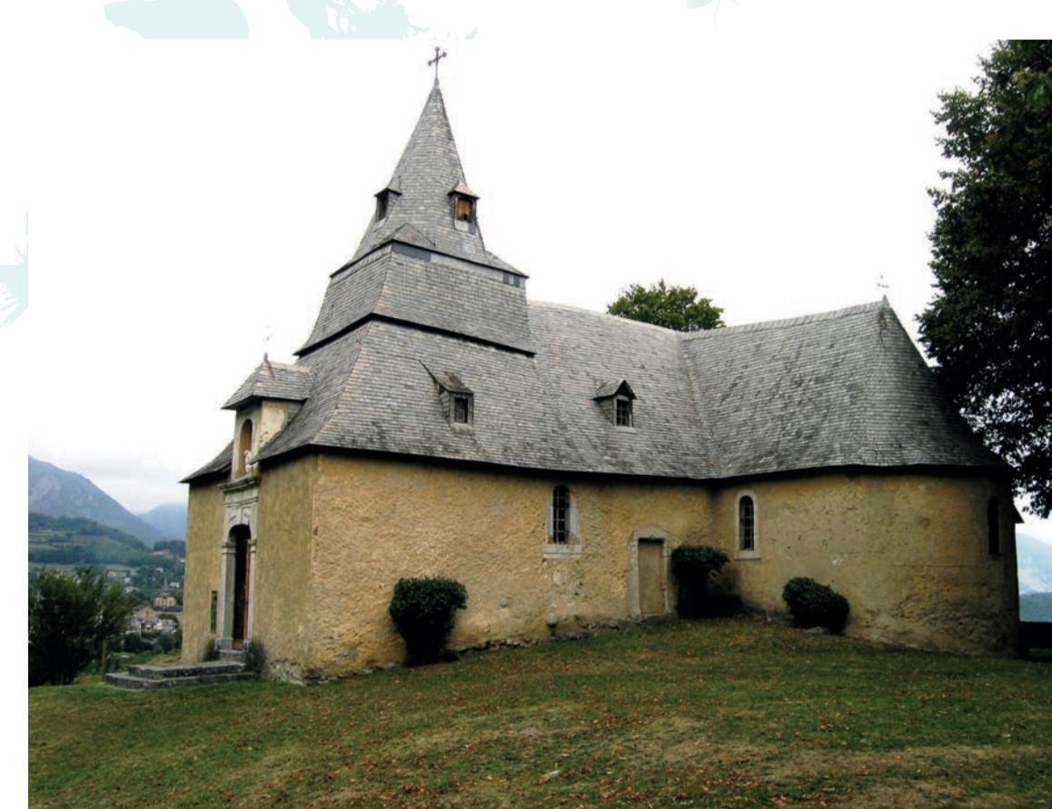
Saint-Savin (65) - chapelle de Piétat inscrite aux MH en 1935