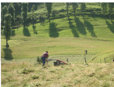
Fauche pédestre à Ordiac, Villelongue Clocher de Bazus-Aure et sa fontaine