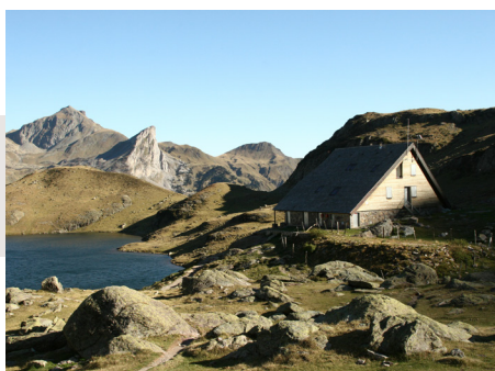
Refuge du lac d'Ayous, Borce

On estime les retombées sur le territoire du Parc national des Pyrénées depuis 2007, à environ 9 000 000,00 €.