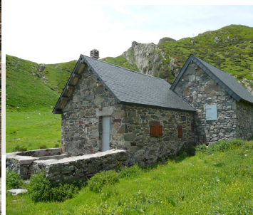
Cabane de Saoutelle, Borce