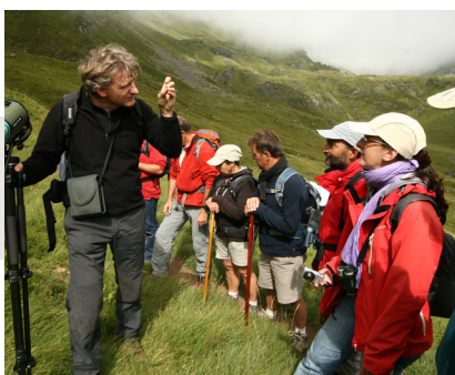
Sortie animations en vallée de Luz