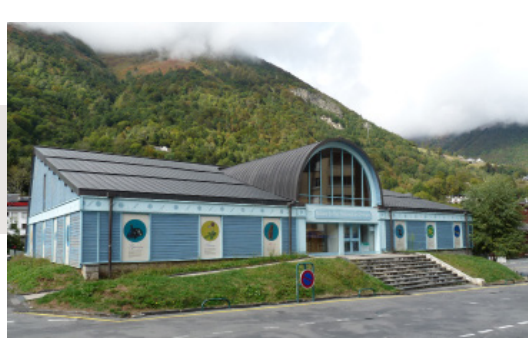
Maison du Parc national des Pyrénées à Cauterets