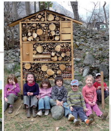
Animation centre de loisirs, Cauterets