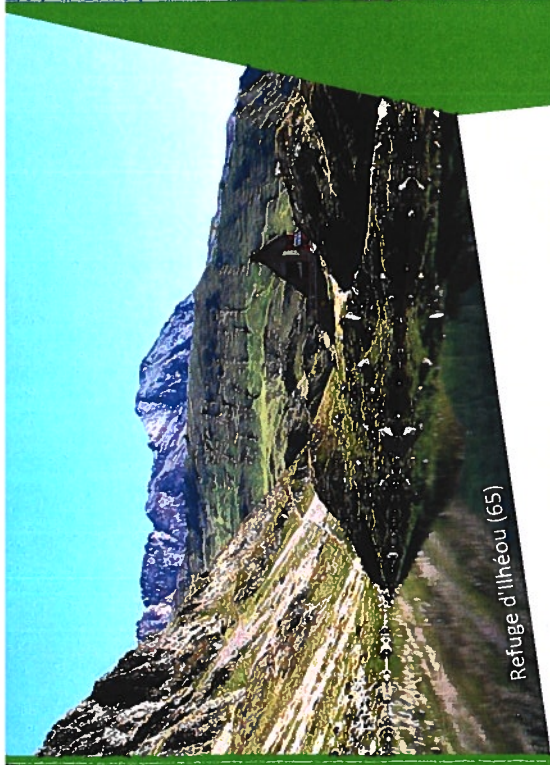
Refuge d'Illhéou (65)

L'ambition de l'Observatoire, en tant que structure de recherche intégrée dans un programme plus vaste, consiste à mettre au service des différents partenaires d'ENTREPYR mais aussi des gardiens et de l'ensemble des acteurs du développement touristique des territoires de montagne, un outil commun d'étude des usagers des refuges et des retombées économiques de leurs activités. Ce projet nécessite une harmonisation méthodologique entre les différents partenaires pour rassembler des données transposables sur l'ensemble du massif pyrénéen afin de faciliter les analyses comparatives. Les résultats obtenus permettront d'élaborer des stratégies coordonnées en vue de mieux répondre aux évolutions des attentes des clientèles nationales et internationales tout en conservant aux refuges leur singularité et leur propre identité.