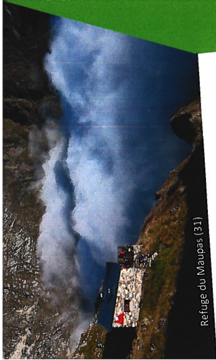
Refuge du Maupas (31)