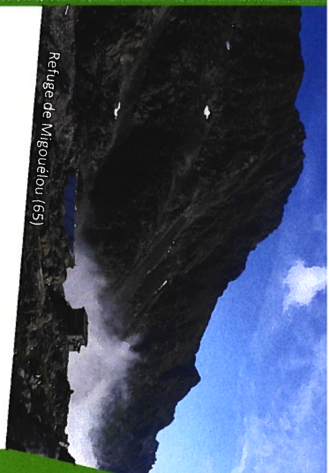
Refuge de Migouérou (65)

Etude sur le rôle d'acteur économique des refuges pour les territoires