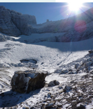
Glacier du Taillon, vue d'ensemble