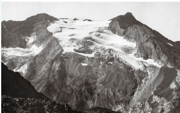
Glacier d'Ossoue en 1911