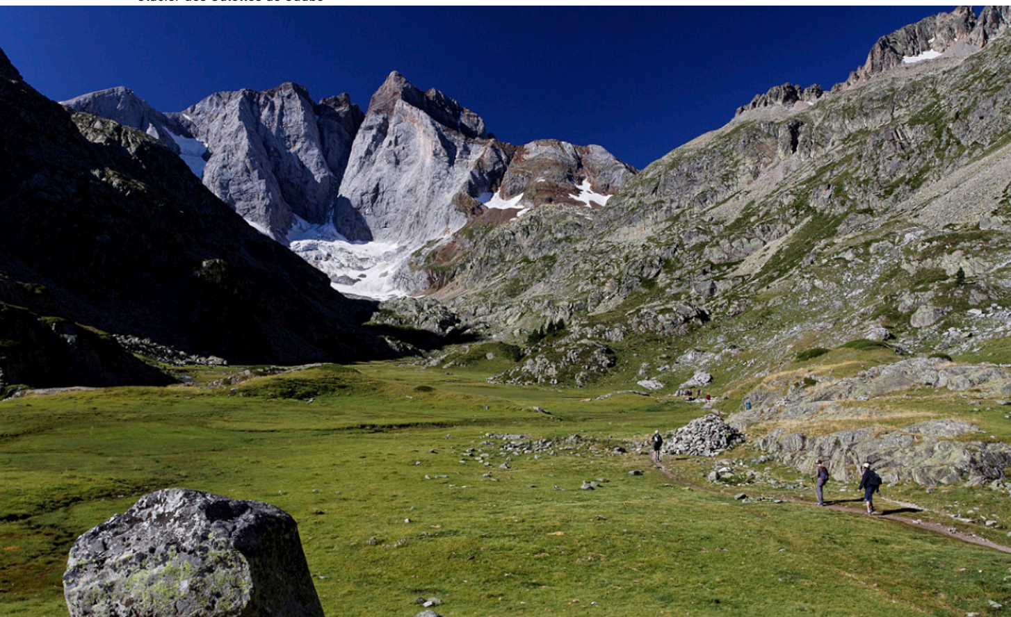
Glacier des Oulettes de Gaube

pierre.rene@wanadoo.fr ou Association MORAINÉ : http://asso.moraine.free.fr