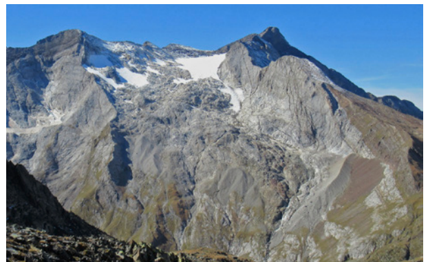
Glacier d'Ossoue en 2021