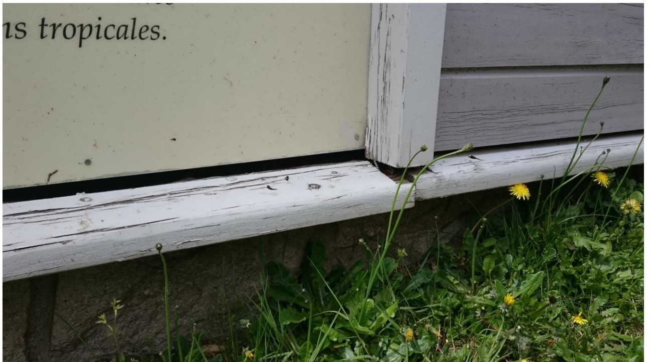
DETAIL SOUBASSEMENT FACADE EST