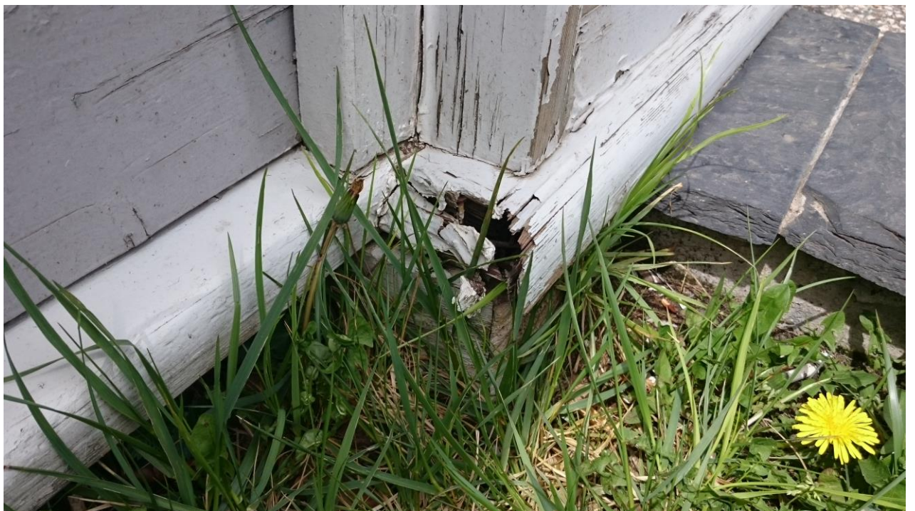
DETAIL SOUBASSEMENT FACADE EST