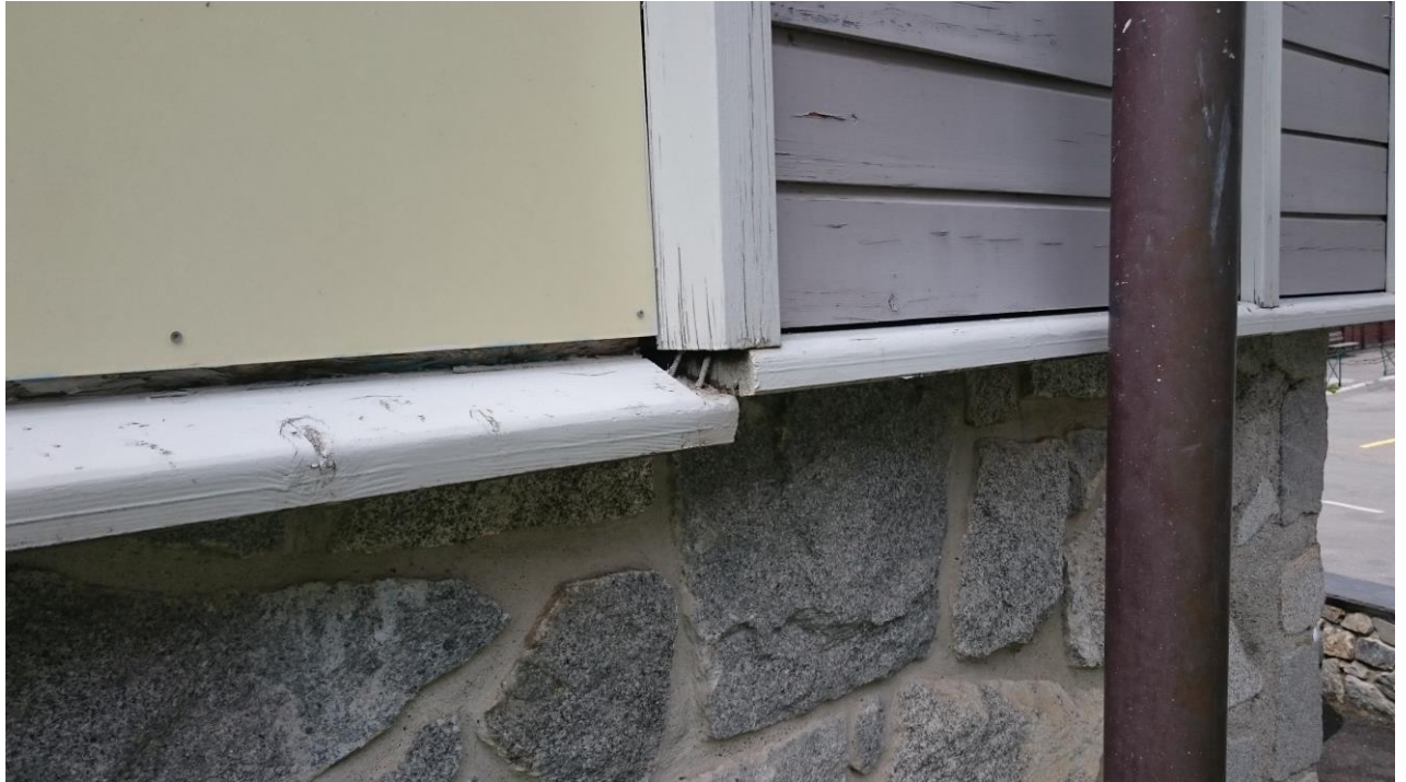
DETAIL SOUBASSEMENT FACADE EST