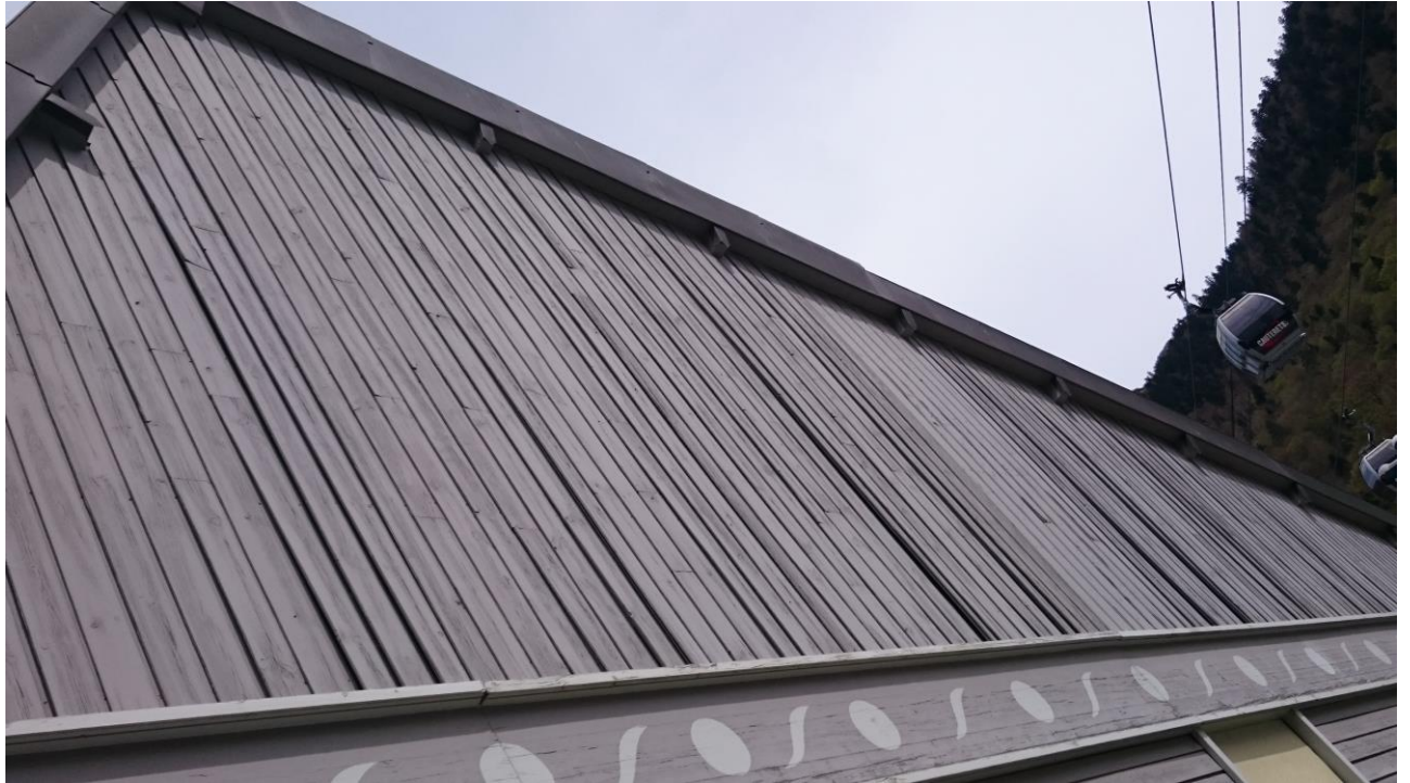
DETAIL PIGNON SUD