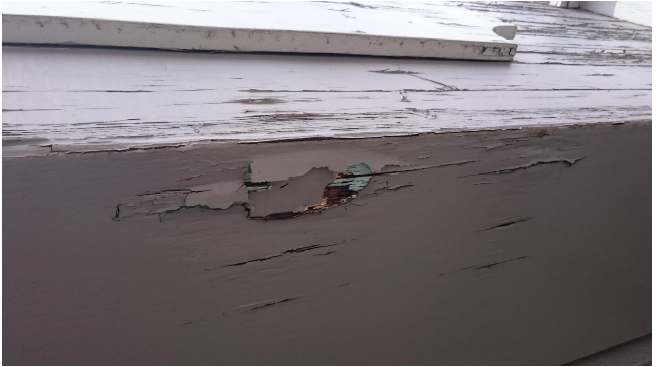
DETAIL SOUS FACE DE LINTEAU ENTREE FACADE EST