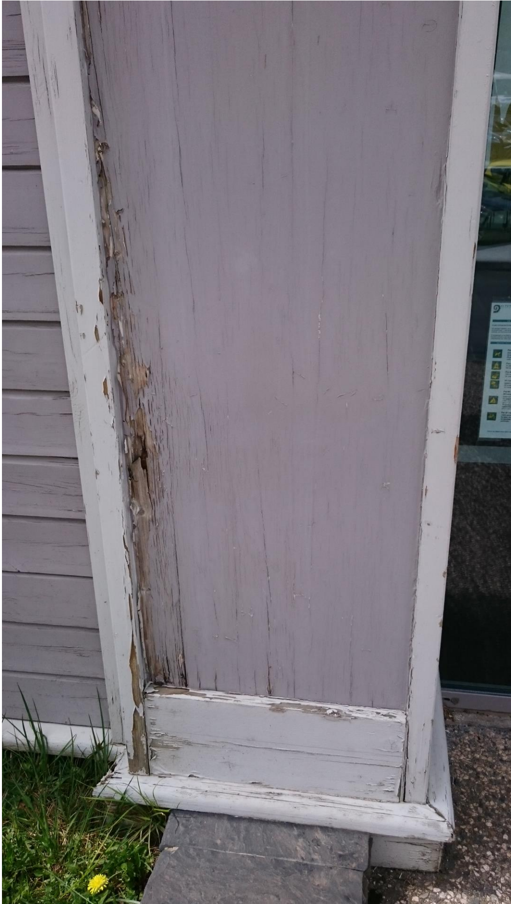
DETAIL HABILLAGE ENTREE FACADE EST