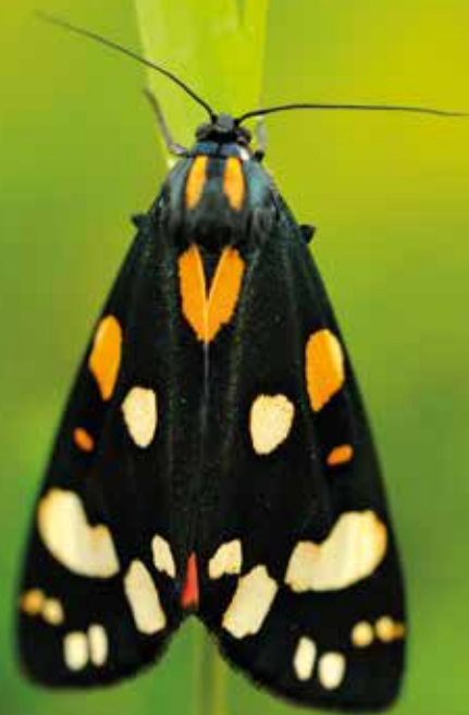
Ecaille marbrée rouge, papillon de nuit