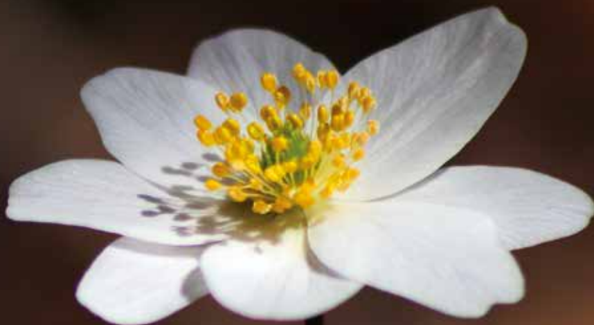
Anémone des bois