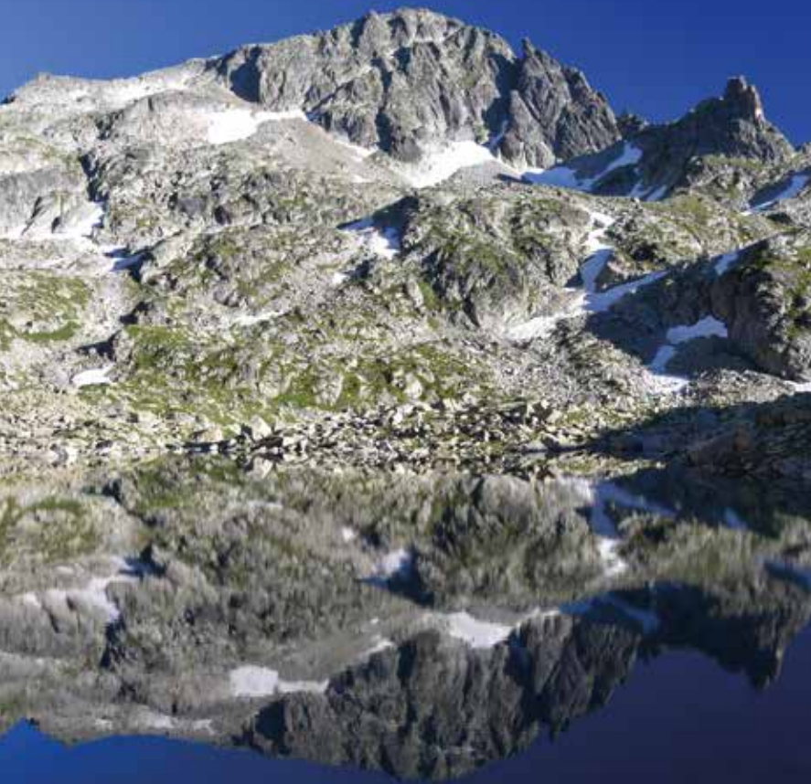
Lac Pouey Laün