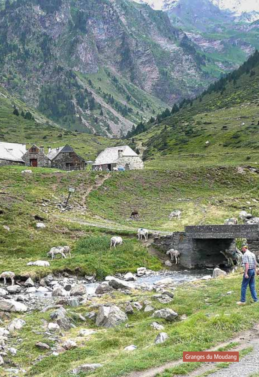
Granges du Moudang