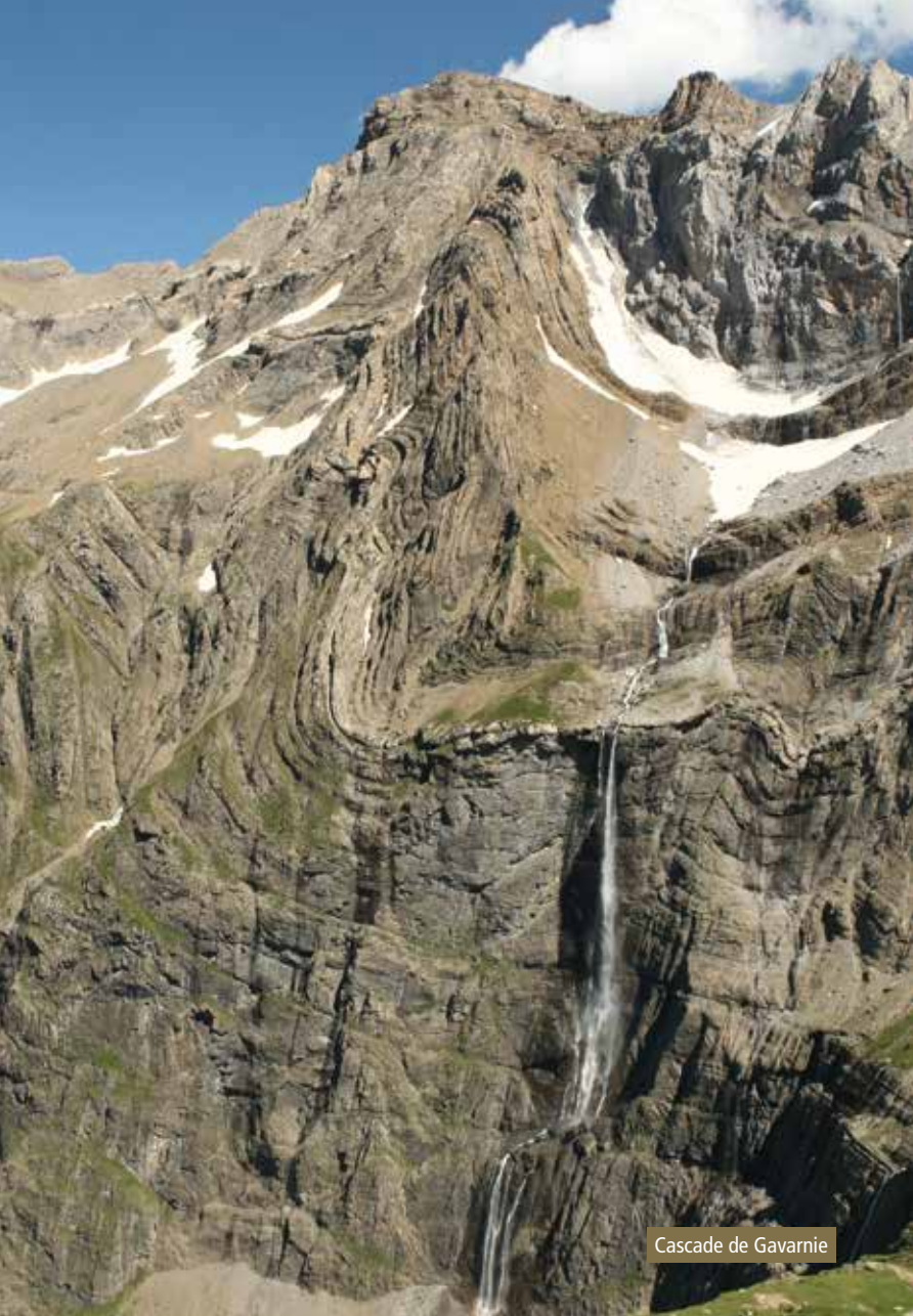
Cascade de Gavarnie