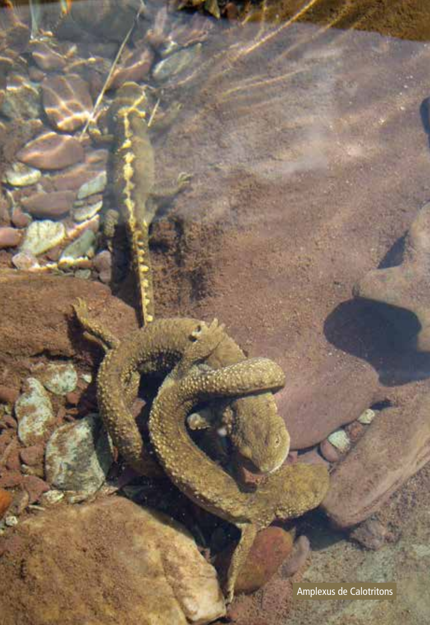
Amplexus de Calotritons