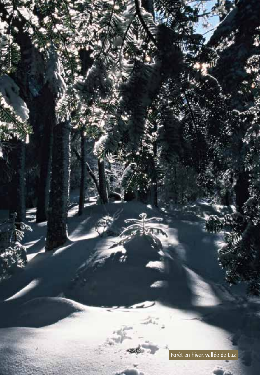
Forêt en hiver, vallée de Luz