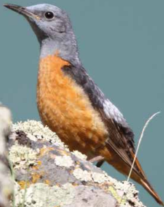
Merle de roche

Rendez-vous à 18 h au refuge des Espuguettes