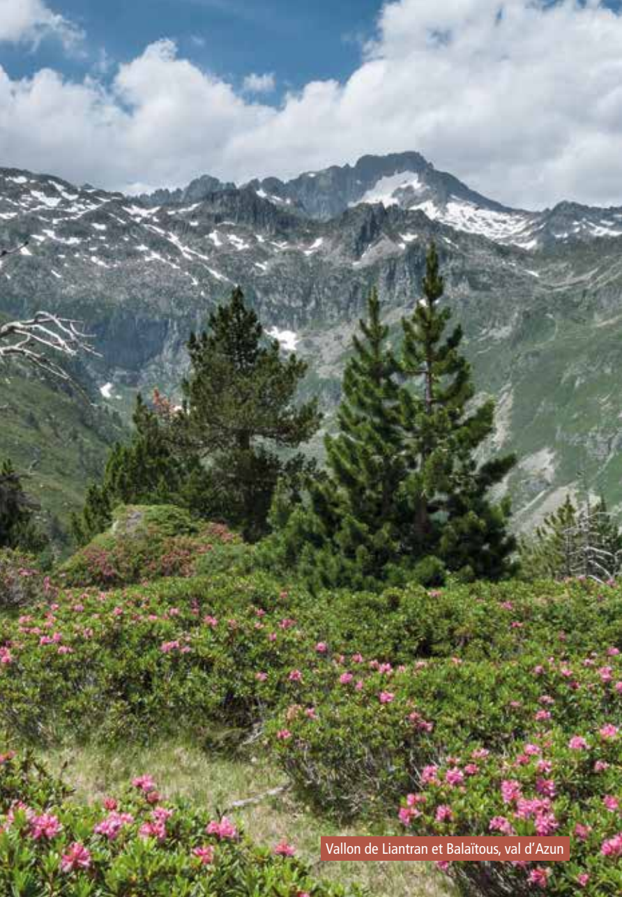
Vallon de Liantran et Balaitous, val d'Azun