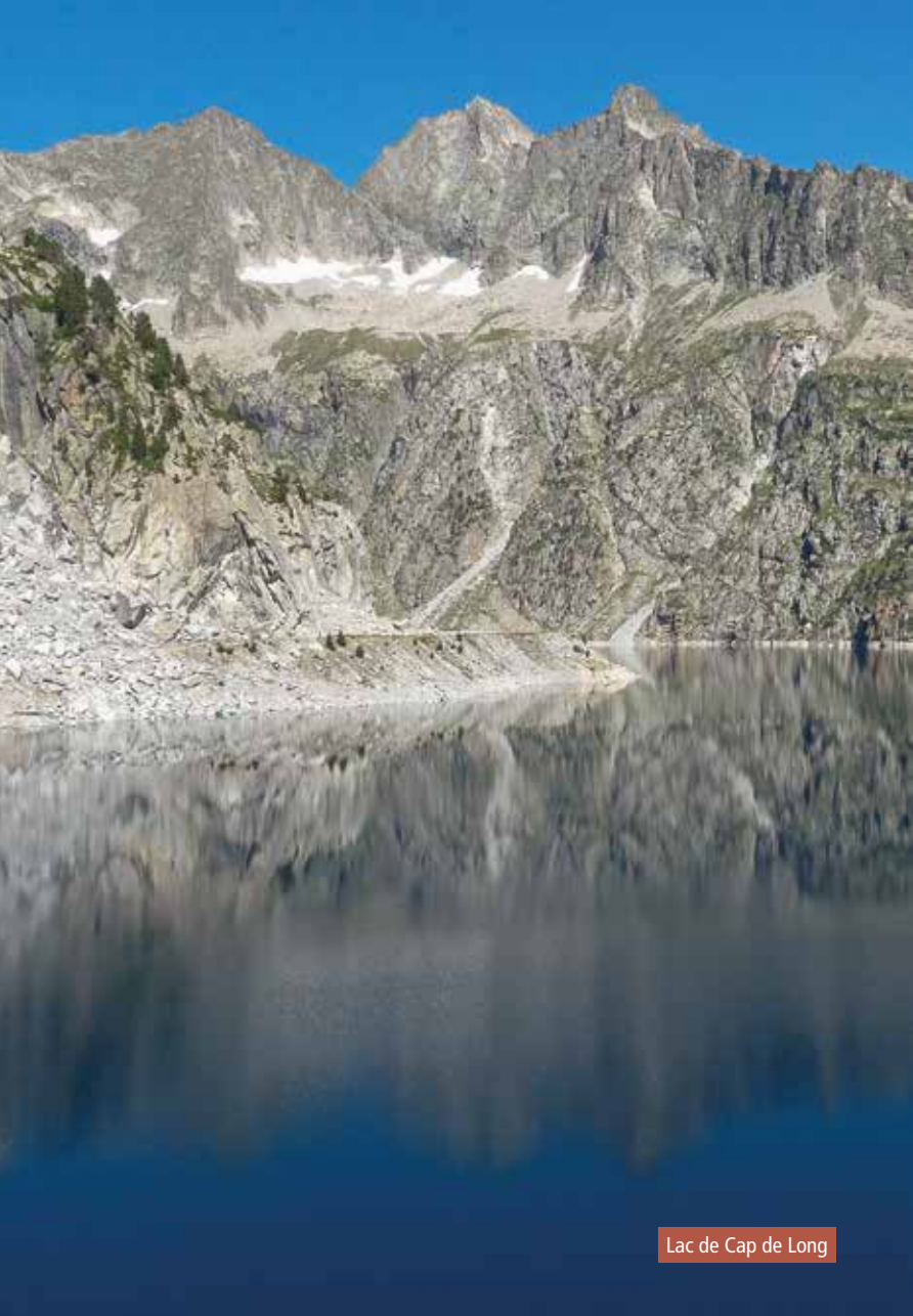
Lac de Cap de Long