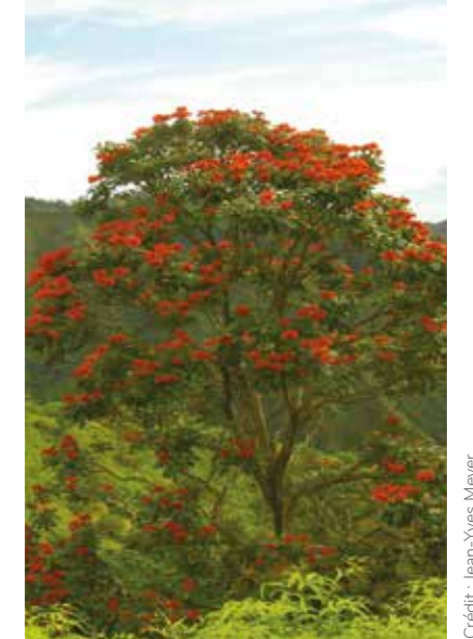
Le flamboyant tulipier du Gabon fait des ravages sur les plante endémiques dans les vallées de Tahiti ou de la Réunion

> Les espèces exotiques envahissantes contribuent à 40 % des extinctions d'espèces enregistrées depuis les 400 dernières années.