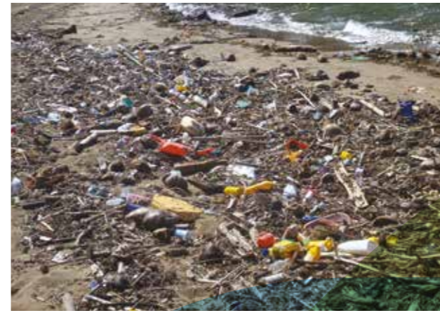
La pollution par les plastiques a été multipliée par 10 depuis 1980