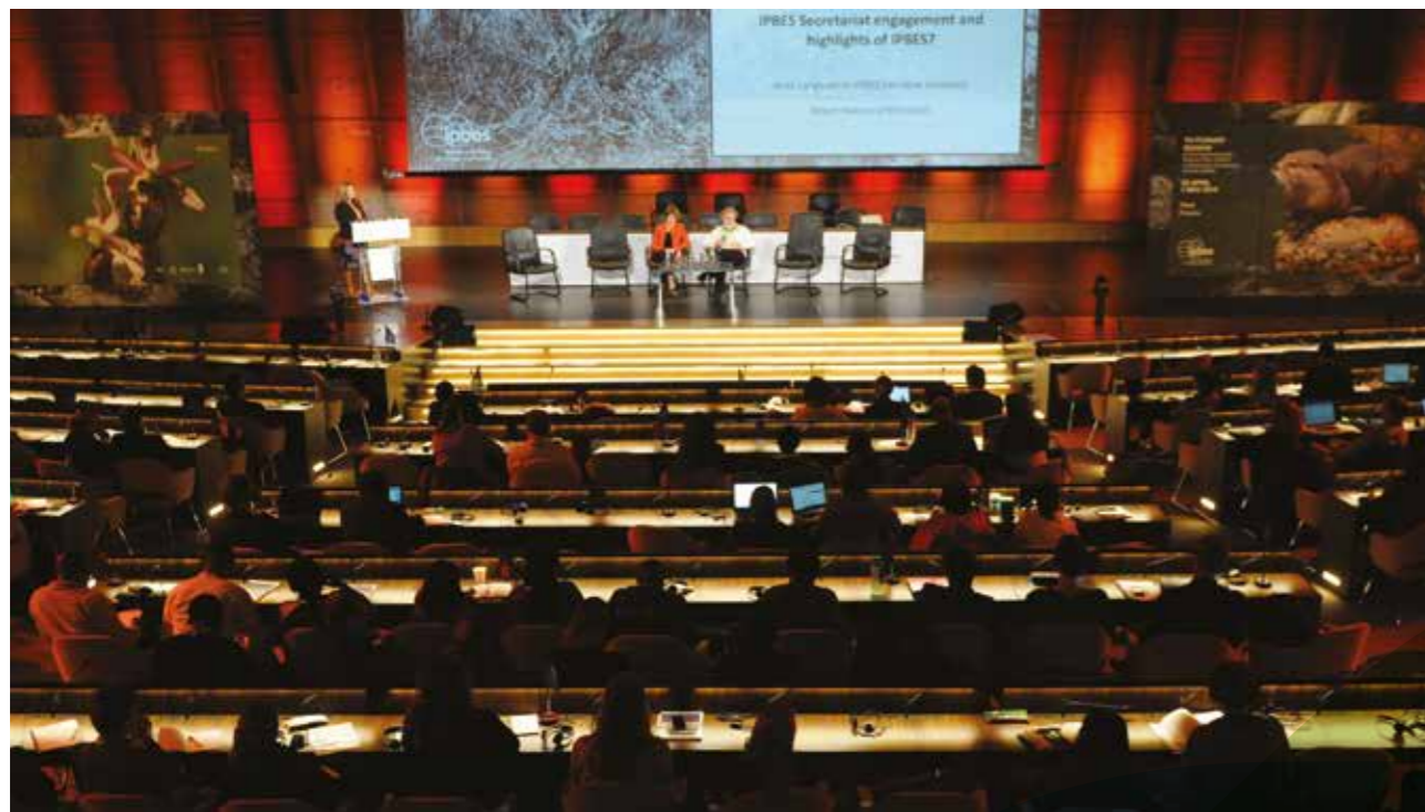
Présentation de la première évaluation mondiale de la biodiversité par l'IPBES, plateforme intergouvernementale sur la biodiversité et les services écosystémiques, à Paris en mai 2019