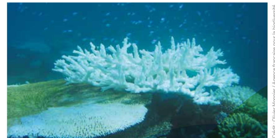
Les récifs coralliens sont la grande victime du réchauffement climatique. Or ils fournissent l'essentiel de la production alimentaire et des revenus à 30 millions de personnes.