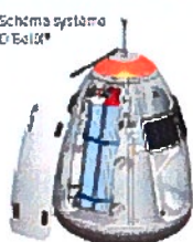
Schéma système O'Belx®